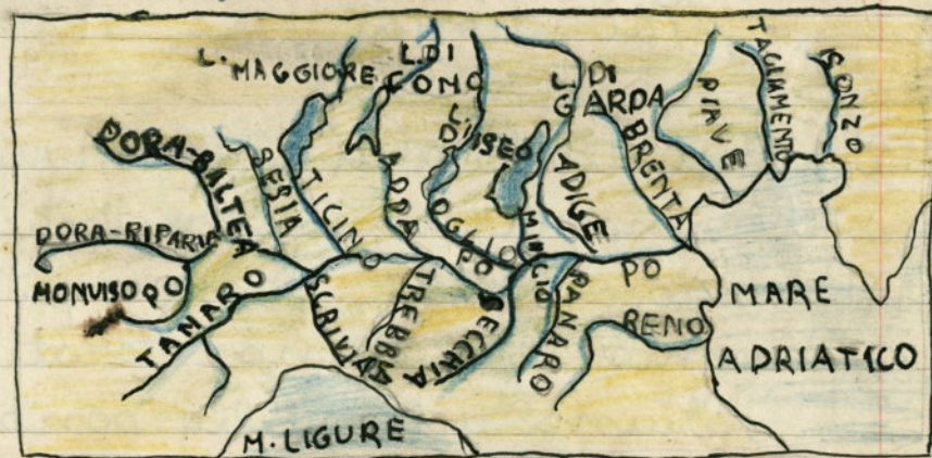
I-FIUMI-DELLA PIANURA PADANO-VENETA.

Ysonzo; Tagliamento; Livenza; Piave; Adige; Brenta; Reno;