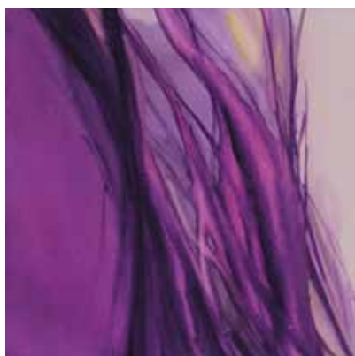
Una delle opere di Cristina Zanella esposta nella personale di pittura "LUMINOSI SILENZI" in occasione di GiardinArt presso il foyer del Teatro Valle dei Laghi

Si comunica che per esigenze di ottimizzazione del lavoro e delle risorse umane disponibili dall'1 AGOSTO 2012 gli Uffici comunali effettueranno il seguente orario di APERTURA AL PUBBLICO ■ TUTTE LE MATTINE (dal lunedì al venerdì) DALLE ORE 8.30 ALLE 12.00 ■ POMERIGGIO LUNEDÌ e GIOVEDÌ DALLE ORE 16.00 ALLE 18.00