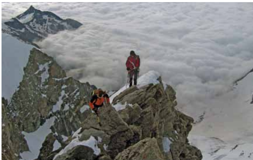
Un'immagine del film "Linea 4000" che verrà proposto nell'ambito di MeseMontagna

La settima edizione di MeseMontagna, che andrà in scena nel mese di novembre, vedrà la presenza di personaggi che hanno fatto o stanno facendo la storia del mondo "verticale" che racconteranno le loro esperienze, proporranno emozionanti filmati e dialogheranno con il pubblico in un clima familiare.