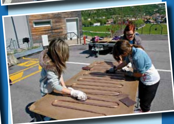
Alcune fasi dell'attività con gli alunni impegnati nella costruzione dell'impianto.