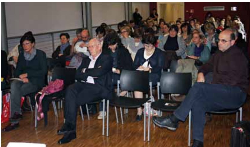
Alcuni momenti delle serate proposte dalla Biblioteca.