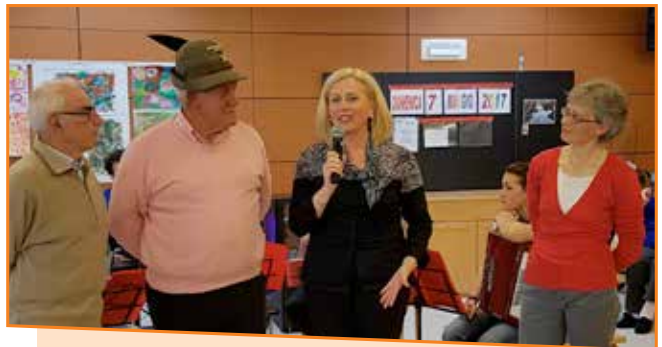
Casa di Riposo di Cavedine con gli Alpini Monte Casale - 7 maggio 2017