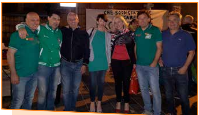
USD Cavedine Lasino – Festa per la promozione – 26 maggio 2017