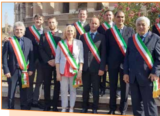
Festa della Repubblica con i Sindaci trentini – Roma – 2 giugno 2017