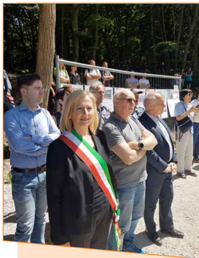
Inaugurazione recupero trincee monte Gaggio con il Gruppo Alpini Cavedine – 28 maggio 2017