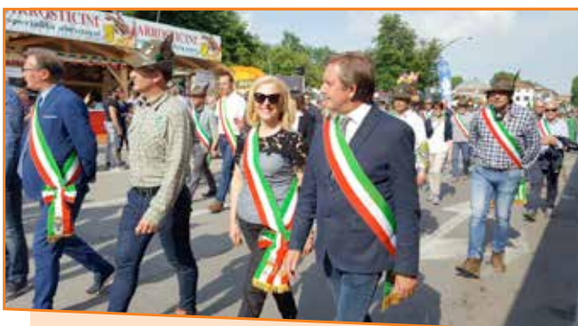
Adunata Alpini a Treviso – 14 maggio 2017