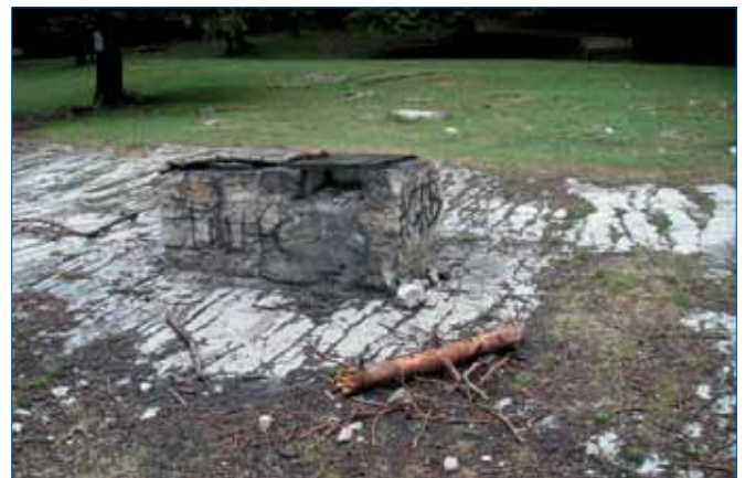
Gli ex fogolari

Un'isola ecologica per il conferimento dei rifiuti differenziati è stata posta nella piazzola tra i due laghi, ritenendo questa una posizione maggiormente visibile, con esposizione di un'adeguata cartellonistica informativa sul rispetto dell'ambiente.