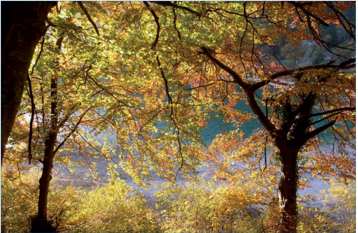
Il Lago di Lamar in autunno