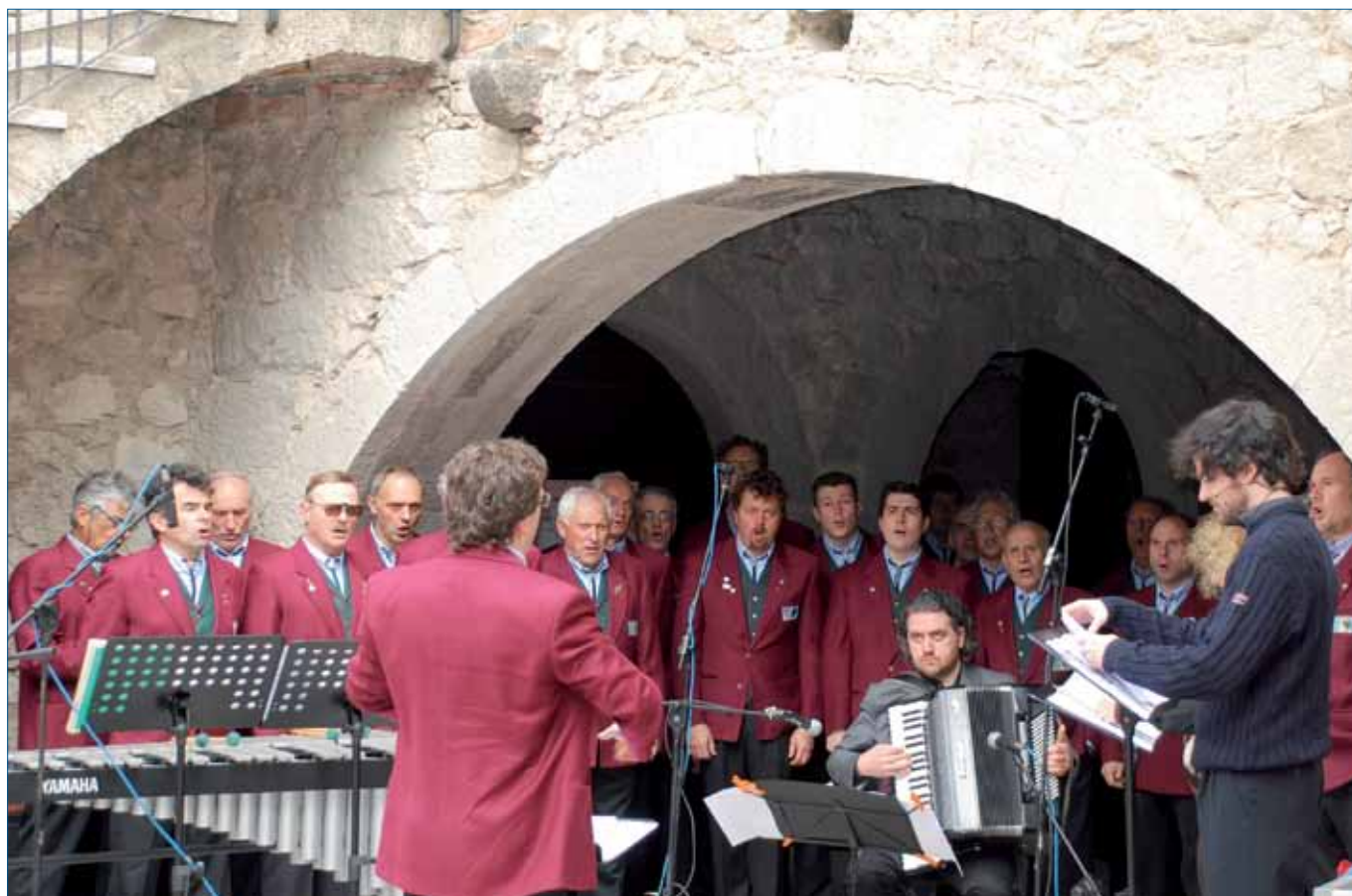
Il Coro Paganella a Castel Drena, in occasione dello spettacolo «Lo sguardo giù dal basso siamo noi»