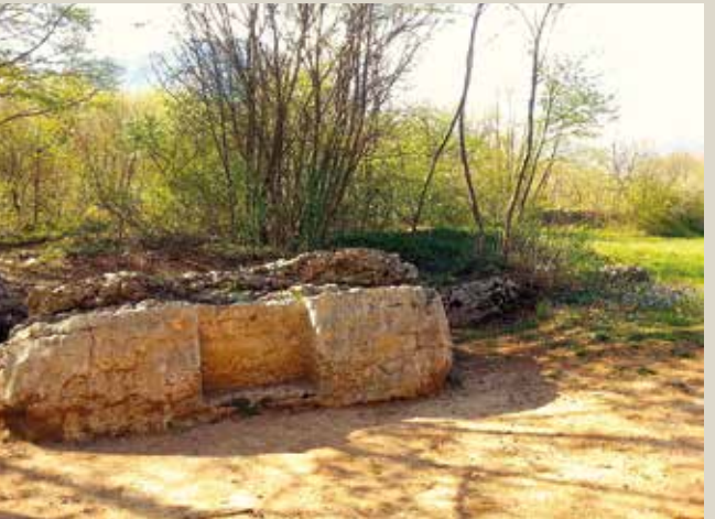
Percorso archeologico Cavedine "Carega del Diàol"