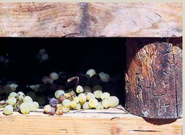
Appassimento dell'uva nosiola sulle "Arèle"