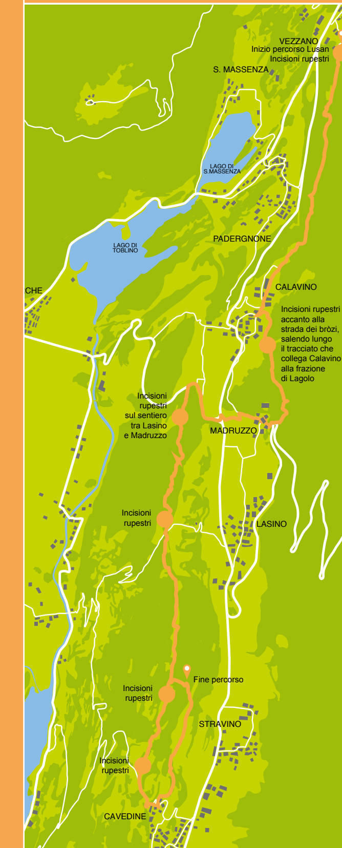
App per Android e iOS: Ecomuseo Valle dei Laghi