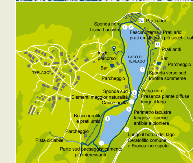
App per Android e iOS: Ecomuseo Valle dei Laghi