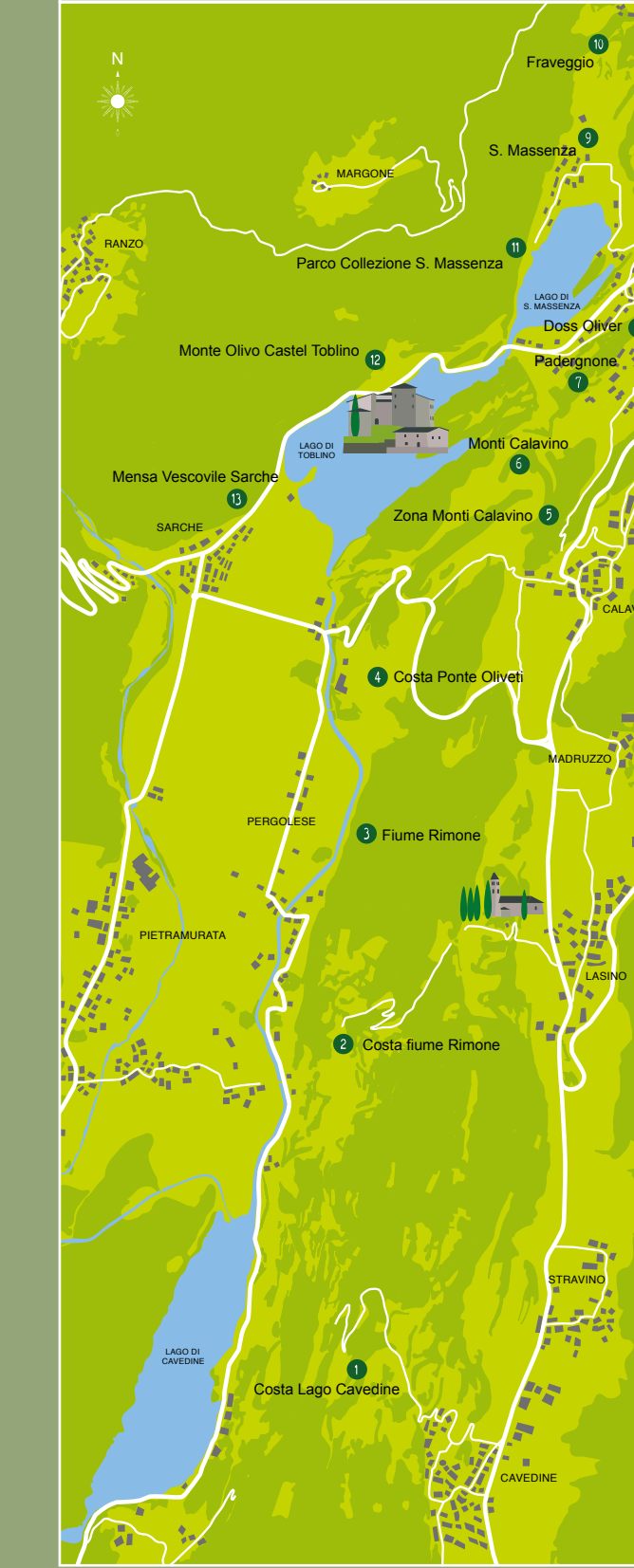
App per Android e iOS: Ecomuseo Valle dei Laghi