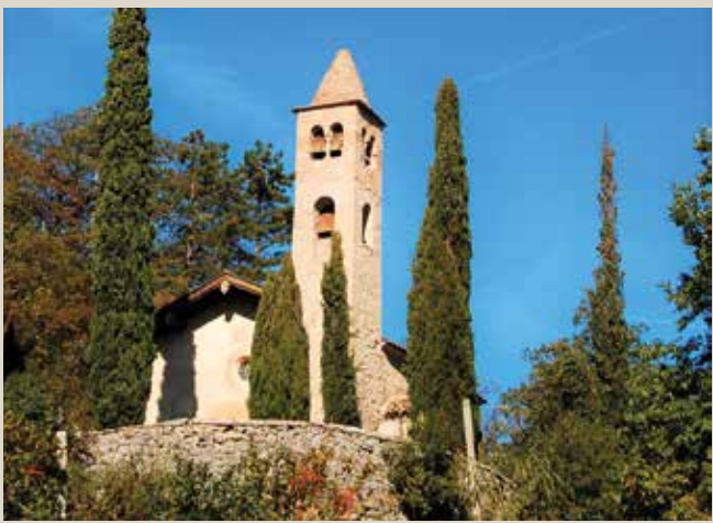
Chiesa di San Siro