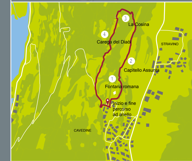
App per Android e iOS: Ecomuseo Valle dei Laghi