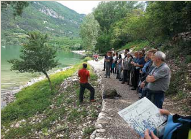
Itinerario "Acqua viva Terlago"

L'Ecomuseo della Valle dei Laghi è come una rete che intreccia aree e temi e che trovano nell'acqua l'elemento trasversale di unione del territorio , un sottile filo che si snoda tra ambiti naturalistici, culturali, della memoria, storici, artistici e della tradizione