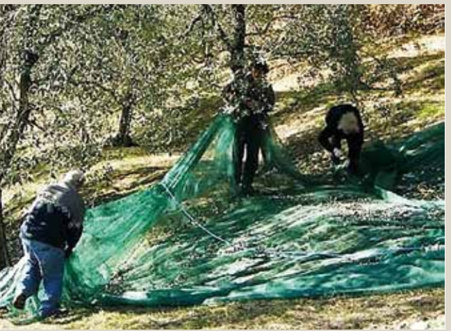
Raccolta delle olive

Per rendere conosciuto il territorio della Valle dei Laghi, l'Ecomuseo ha sviluppato alcuni nuovi percorsi e ha avvalorato itinerari già esistenti che accompagnano il visitatore alla scoperta di magnifici luoghi, ricchi di storia, arte, cultura, natura; luoghi forgiati dalla natura o modellati dal lavoro dell'uomo che, con le sue mani, ha connotato in parte il paesaggio della valle. Gli itinerari avvicinano chi li percorre alla quiete del luogo e alla cultura del territorio.