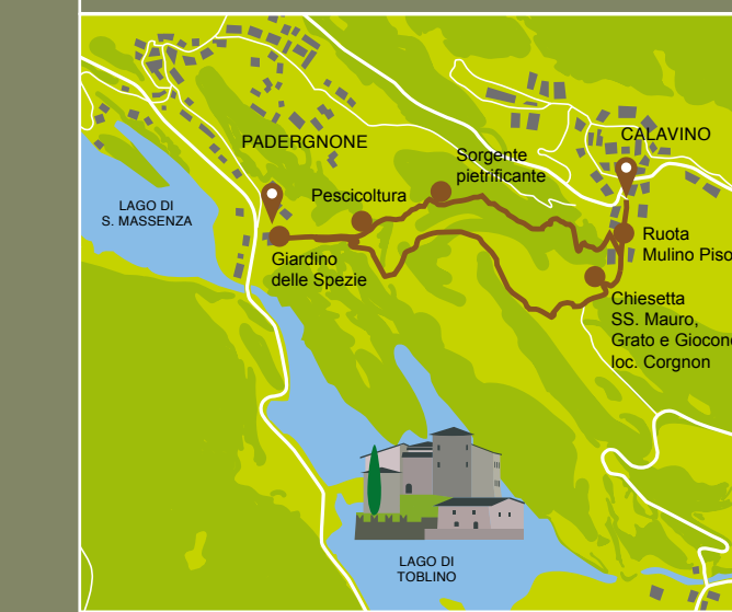
App per Android e iOS: Ecomuseo Valle dei Laghi