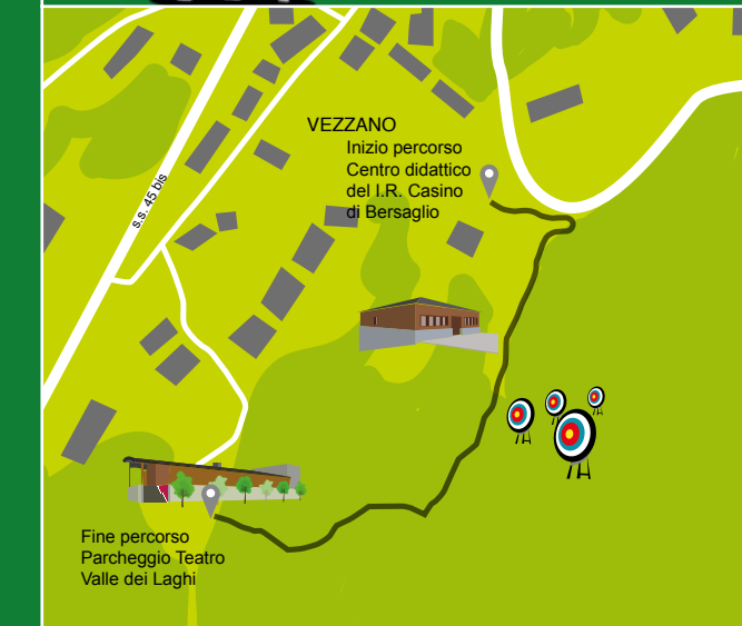
App per Android e iOS: Ecomuseo Valle dei Laghi