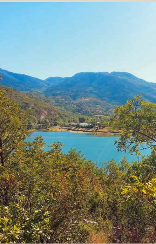
Lago di Terlago