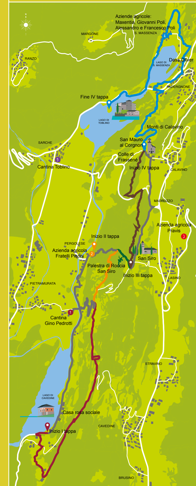
App per Android e iOS: Ecomuseo Valle dei Laghi