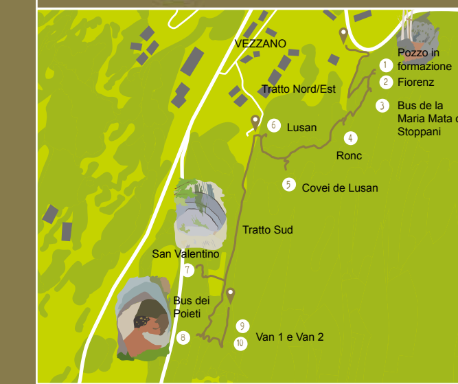
App per Android e iOS: Ecomuseo Valle dei Laghi