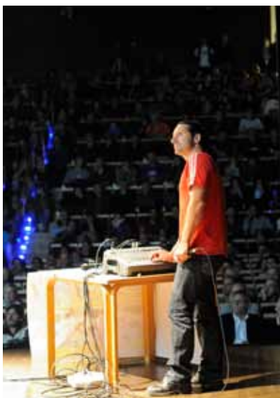
Alexander Huber davanti ad una platea attenta ed emozionata

L'incontro con Huber è stato preceduto dalla premiazione del Concorso "Fotografa la Valle dei Laghi" promosso dal Gruppo Culturale N. C. Garbari e dall'apertura della mostra fotografica alla quale era affiancata una mostra per il trentennale della ferrata Rino Pisetta.