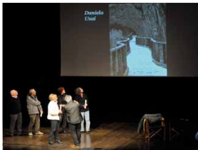
Le premiazioni degli “scatti” vincitori del concorso fotografico nelle tre diverse sezioni (foto M. Pilati)

Il primo appuntamento di “Me-se Montagna”: un’emozionante serata con il re dell’arrampicata libera Alexander Huber, è stato preceduto dall’inaugurazione della mostra delle foto, che hanno partecipato al concorso “Fotografa la Valle dei Laghi”, tema “Le stagioni”. Le 144 opere di 41 autori sono state in esposizione fino al 30 novembre nella galleria del Teatro Valle dei Laghi. Il concorso è stato proposto dal gruppo culturale “Nereo Cesare Garbari” del Distretto di Vezzano, in collaborazione con la biblioteca intercomunale di Vezzano, Padergnone e Terlago, con il patrocinio della Commissione culturale intercomunale della Valle dei Laghi, della Comunità di valle, della Cassa rurale, dell’Apt Trento, Monte Bondone, Valle dei Laghi.