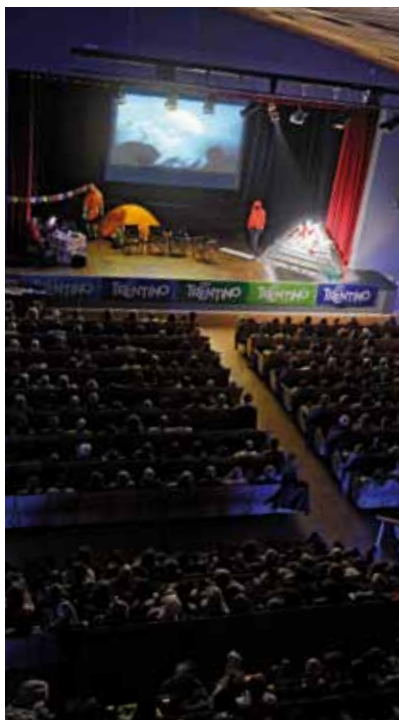
Il pubblico delle grandi occasioni per la serata di Kurt Diembeger

Il Teatro di Valle era strapieno per ascoltare dalla viva voce dei due grandi protagonisti le fatiche, i sacrifici, le delusioni, le crisi profonde, ma anche le gioie immense per il raggiungimento dell'obiettivo. L'impegno nel sociale con il sostegno a