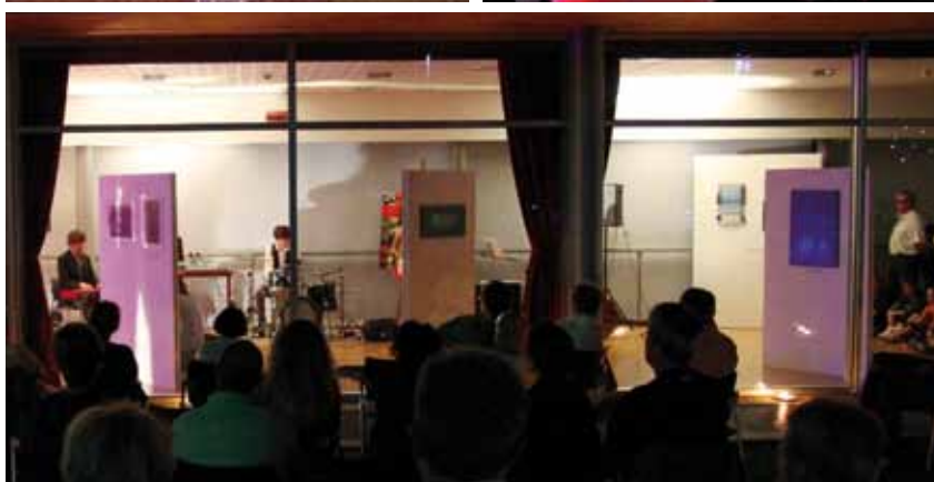
Carrellata di immagini della manifestazione