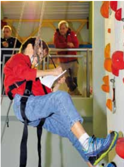
"Parole appese" l'appuntamento svolto all'interno di MeseMontagna realizzato in collaborazione con il Premio Itas

Una mostra bibliografica particolare, organizzata in collaborazione con ITAS e dedicata ai libri che nel corso degli anni si sono aggiudicati il Cardo d'oro del Premio Itas Libro di Montagna. Sono ancora disponibili in biblioteca gli opuscoli relativi, per letture che sono viaggi, anche dentro se stessi.