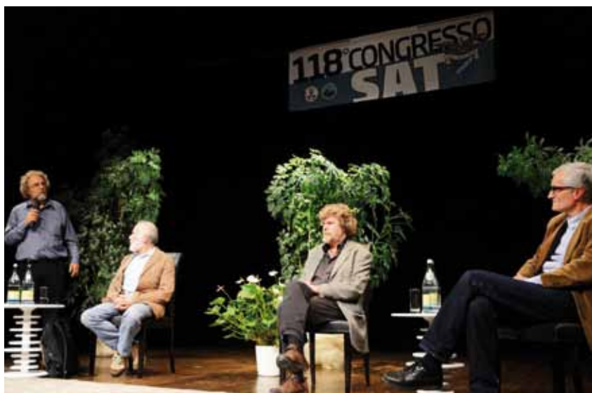
La serata con Reinhold Messner

Ennio Lappi è stato il protagonista di due interessanti e partecipati incontri sul tema "paesaggio idroelettrico".