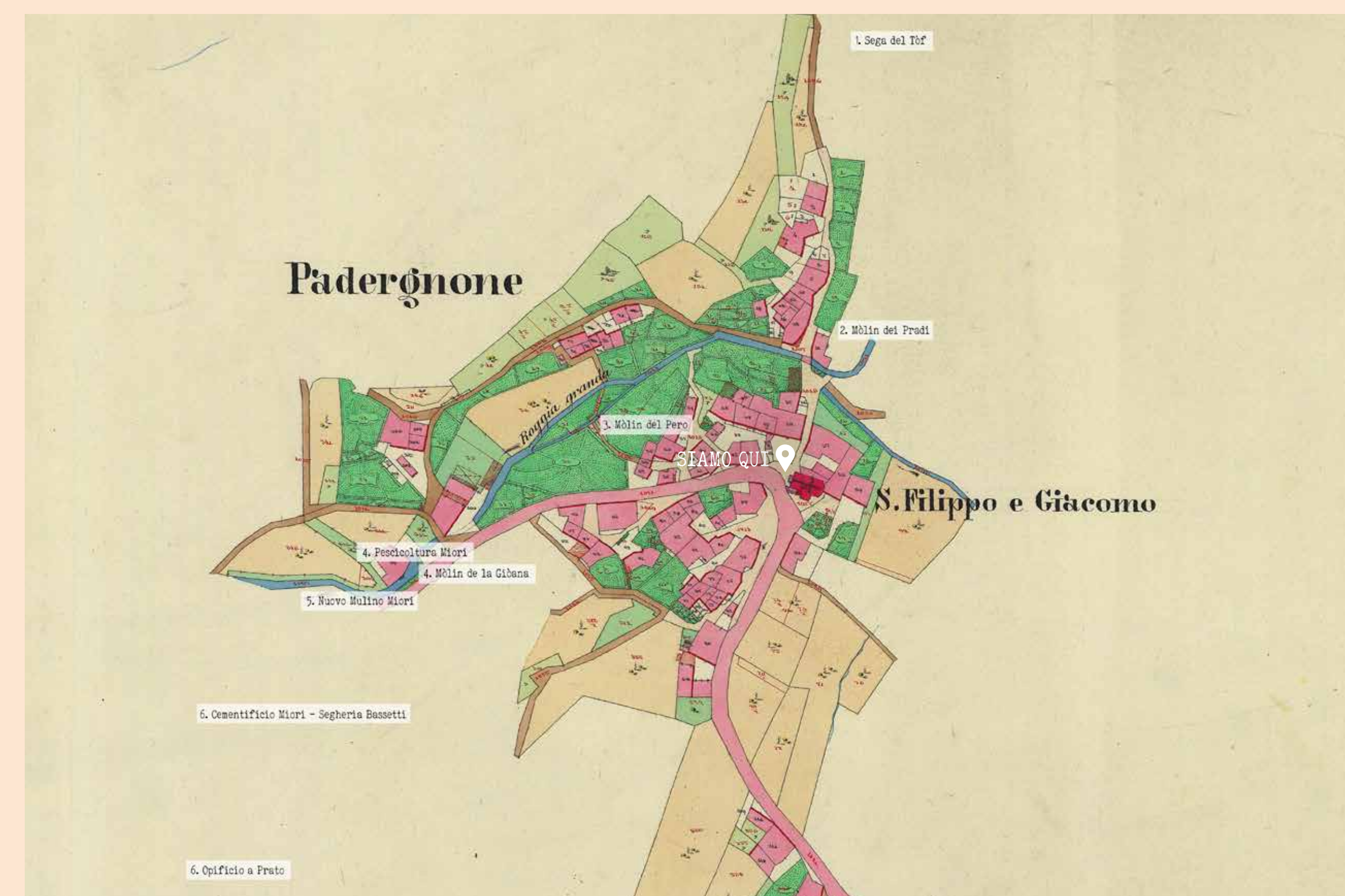
Mappa catastale asburgica del 1860 The Habsburg Cadastral map of 1860