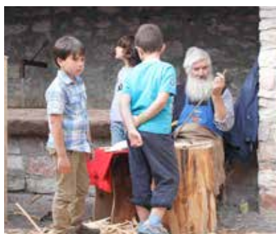
Il “Boulder Festival”, la novità della Sagra, e le altre iniziative hanno catturato l’attenzione di grandi e piccini