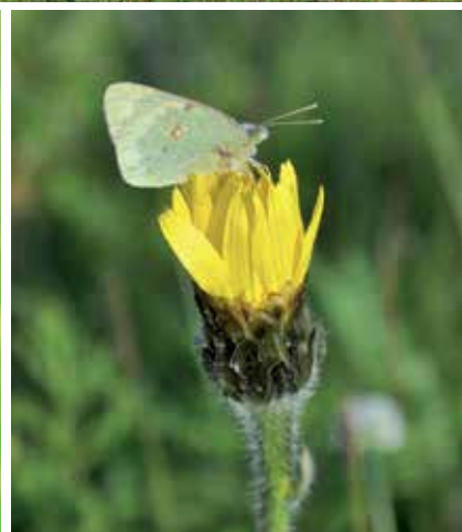
"Cartolina" dal Monte Gazza