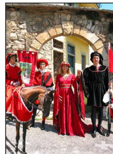
Ricordando il XII PALIO DELLE 7 FRAZIONI 3 agosto 2003

Storia-cultura-tradizioni-società-ambiente