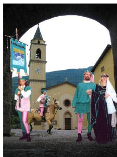
Ricordando l'XI PALIO DELLE 7 FRAZIONI 14 luglio 2002

SANTA MASSENZA Storia-cultura-tradizioni-società-ambiente