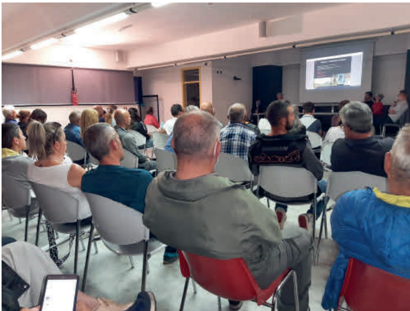
Serata "Il lupo in Trentino"