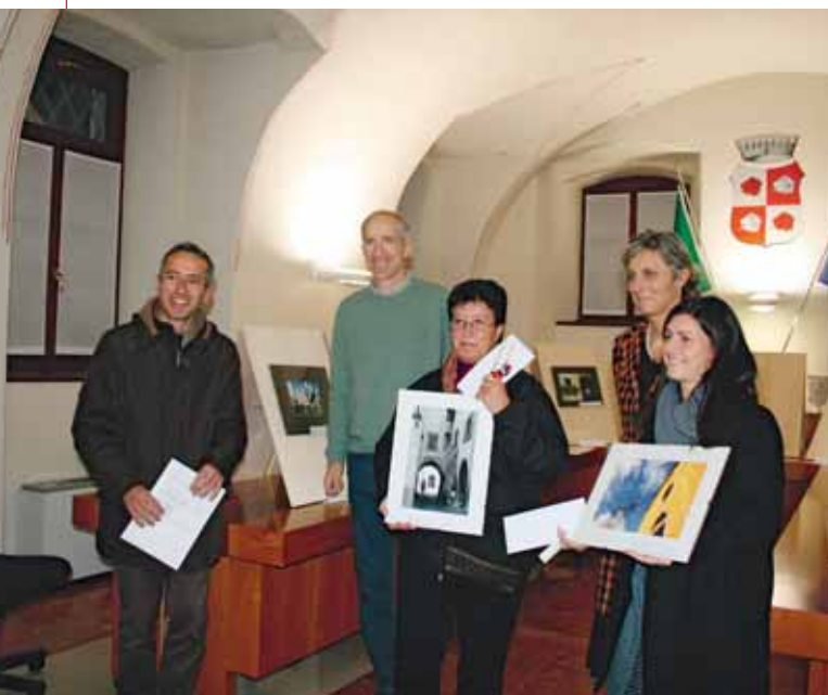
Concorso fotografico: le foto vincenti

le danzatrici della compagnia LAM che, lungo un percorso guidato dalle luci e dal suono, mimavano alcune delle sculture, cogliendone le posture e le emozioni, interpretandone le movenze, diventando a loro volta sculture in movimento, gli stessi familiari, hanno partecipato chiudendo l'esibizione.