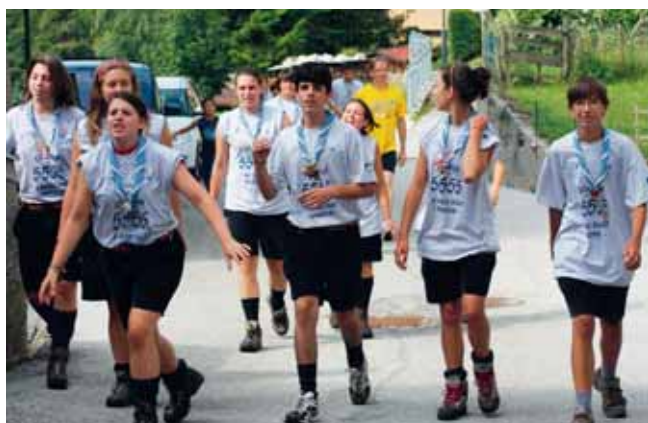
La corsa dei 5555 metri e la Festa dell'Ospite

Anche l'anno 2009, per il Gruppo culturale Nereo Garbari, è stato particolarmente attivo mantenendosi ai livelli degli ultimi anni. Le iniziative intraprese si sono rivelate molto interessanti e sono state possibili, grazie al lavoro di un affiatato ed eterogeneo Direttivo che si è prestato con entusiasmo, sviluppando e mettendo in pratica idee talora impegnative.