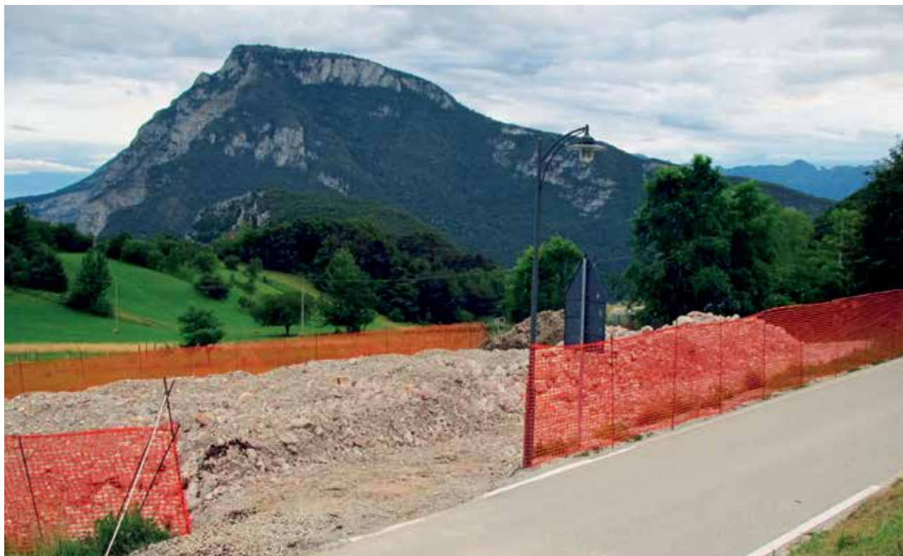
Il terreno interessato dai lavori per la realizzazione di un parcheggio nella frazione di Margone

N. 96 del 28.10.2014 – Determina di dar corso alla procedura abbreviata di esproprio per l'acquisizione della neo formata p.f. 76/4 C.C. Fraveggio I° di mq. 594 interessata dai lavori realizzazione di un parcheggio; di disporre pertanto il pagamento delle indennità di espropriazione, conseguenti ai lavori in oggetto, ai proprietari delle particelle come segue, in conformità alle stime redatte dall'Ufficio Tecnico