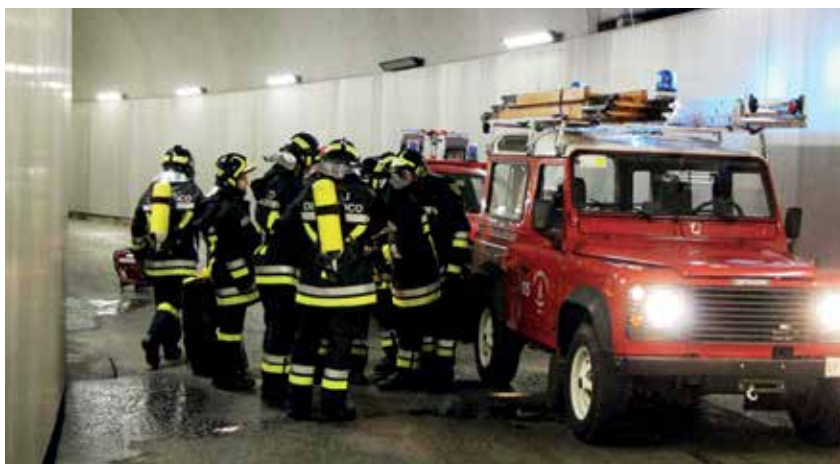
Alcuni momenti dell'esercitazione alla Centrale idroelettrica di S. Massenza

Dopo aver bonificato l'area contaminata dai fumi tossici e tratto il salvo alcuni dei visitatori, le ricerche si sono concentrate nella ricerca di alcuni dispersi. Alcuni ritrovati nei pressi delle potenti turbine, altri in angusti cunicoli di servizio sotterranei dove ave-