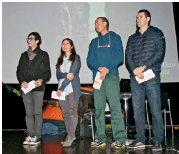
I premiati della varie sezioni sul palco del Teatro Valle dei Laghi