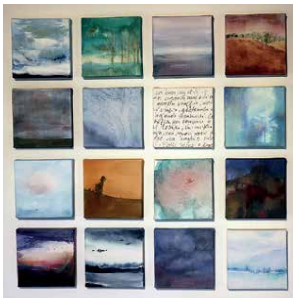
Un'opera dell'artista Cristina Zanella esposta alla mostra Appunti di un viaggio

È la prima domenica di settembre comunque il centro di Tutti i colori della pace , l'evento che ha dato il la a tutta la manifestazione: la festa del voto con la processione pomeridiana al santuario di s. Valentino in agro con una grande partecipazione di fedeli e l'accompagnamento della Banda del Borgo di Vezzano che ha concluso la giornata con un apprezzato concerto.