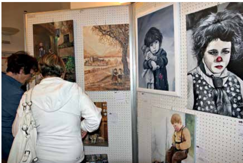
Un momento della mostra proposta dagli artisti dell'Associazione Melograno di Padergnone, dal titolo ... e lo chiamavano arrivederci

Come si diceva, la manifestazione è partita a Padergnone con l'inaugurazione della mostra degli artisti dell'Associazione Melograno, dal titolo molto evocativo, ... e lo chiamavano arrivederci , che hanno messo su tela le sensazioni mosse dal periodo di guerra nella gente della nostra valle. Le voci di alcuni reduci della nostra terra, giunte a noi attraverso i