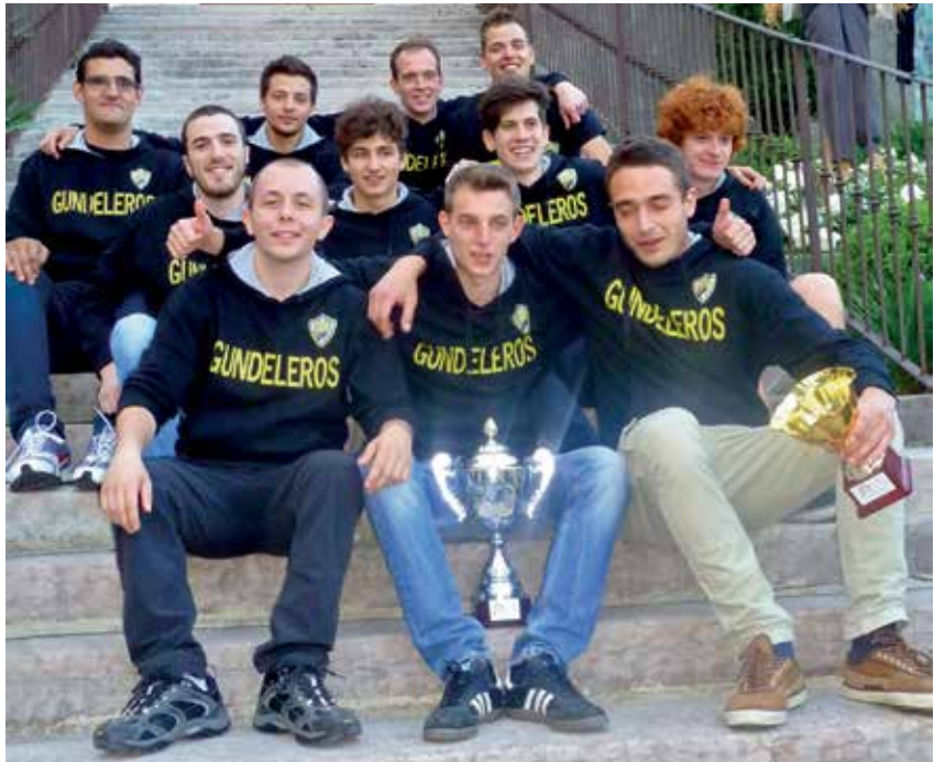
I ragazzi del calcio a 5, festanti dopo una vittoria e impegnati nei lavori per l'allestimento della Sagra dei Portoni

Parallelamente all'attività organizzativa si è svolta quella sportiva con