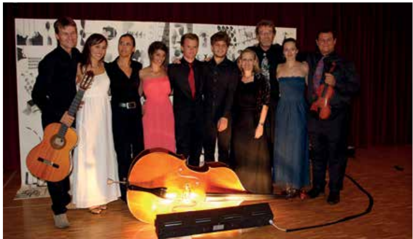
Immagini di alcuni appuntamenti di "Tutti i colori della pace"

mo nel nostro impegno consci che la cultura, rifacendosi al significato originario, ovvero coltivare, richiede un'assidua cura. Siamo convinti che l'offerta culturale debba essere quanto più possibile varia e di qualità in modo da offrire a tutti occasioni di arricchimento e di crescita.