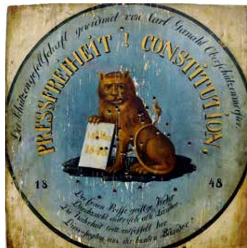
Tiro al bersaglio "Libertà di stampa! Costituzione!"; Feldkirch (Vorarlberg) 1848

Certi briganti 'italiani' – Il 15 di marzo si rivoltò Budapest sotto la guida di Kossuth e Petöfi. Quattro giorni dopo Vienna, il 17 di marzo, insorse Venezia, e il giorno dopo, il 18, fu la volta di Milano, che pose Radetzky di fronte all'alternativa di darsela a gambe con i suoi scherani oppure di bombardare una delle città più ricche e colte dell'impero. A Trento il Magistrato, soddisfatto per la prospettiva di riforme, si preoccupava per l'ordine pubblico, e fu subito accontentato dalla guardia civica, che si costituì decorata da una coccarda tricolore. Il 19 marzo a Praga si sollevarono anche i cechi, chiedendo autonomie e indipendenza. Cinque giorni dopo, il 24 marzo, iniziava la guerra federale per l'indipendenza italiana, e i piemontesi con Carlo Alberto varcarono il Ticino in attesa d'essere affiancati dalle truppe pontificie del Durando, da quelle napoletane del Pepe, e dai volontari to-