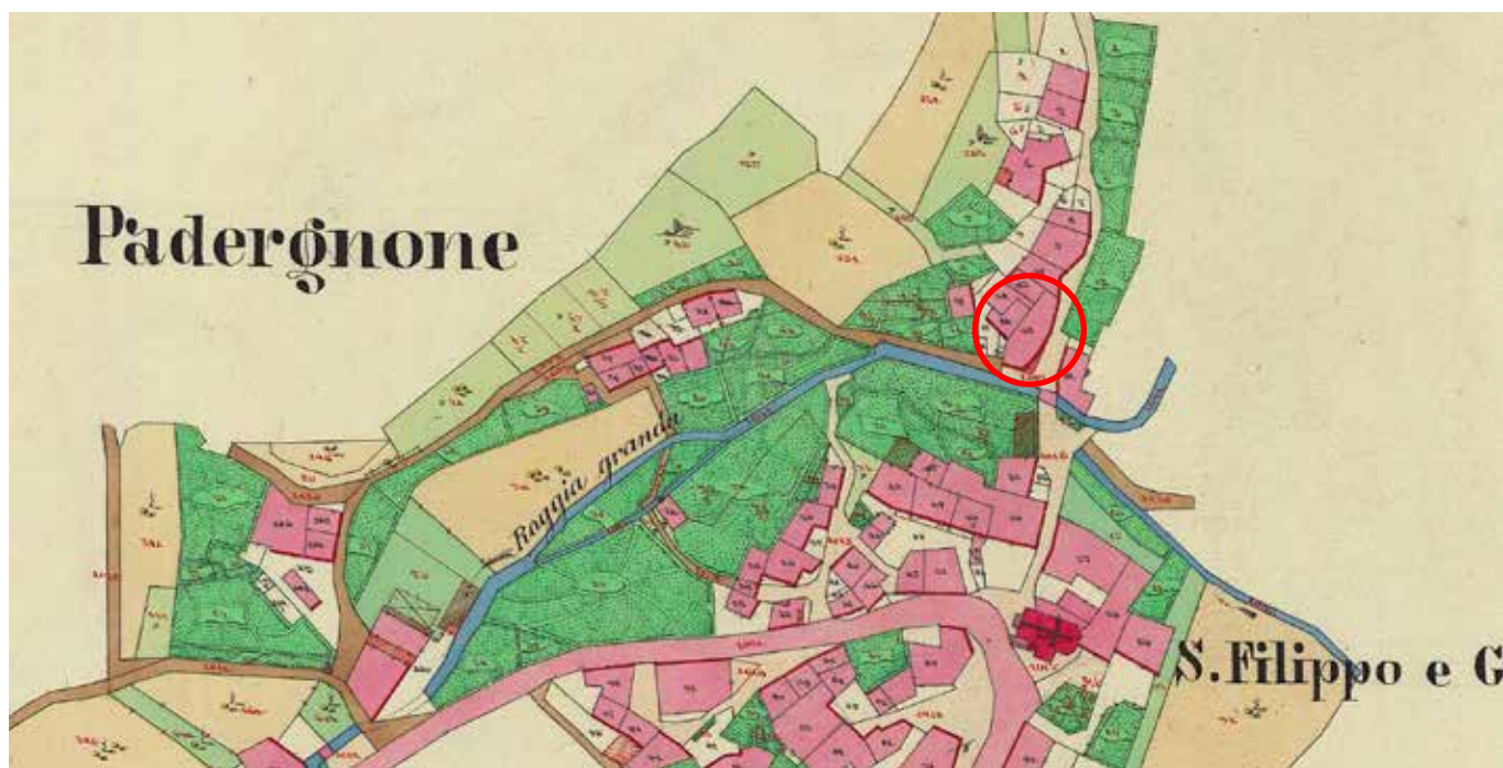
La scuola "sulla via che porta a Vezzano"

A tutto questo s'aggiungeva il fatto che la stanza della cancelleria comunale era poco agibile da parte dell'amministrazione, e quindi era necessario un ulteriore accomodamento all'interno della casa canonica. Allora, nel settembre del 1862 – proprio quando a Trento si apriva la scuola popolare di lingua tedesca con annesso giardino d'infanzia –, si giunse ad un accordo fra i due annosi contendenti, secondo il quale il curato, desideroso che il comune si comodi per sempre, cede volentieri la stanza davanti ad uso di locale scolastico, onde il comune possa avere ad uso di cancelleria quella di dietro . La cessione della stanza, tuttavia, era da considerarsi valida per i soli sei mesi di scuola – da novembre a tutto aprile. Ed era subordinata a tutta una lunga serie di condizioni: dovevano essere murate tutte le porte che introducevano dalla nuova cancelleria negli appartamenti curaziali; altre migliorie dovevano essere effettuate alla canonica entro la prossima pasqua; e soprattutto doveva essere allestita, a spese del comune, una stanza da banchi da seta ad uso del curato. Senza dimenticare la raccomandazione che la gente non venga in cancelleria che per cose d'ufficio, e non per chiassare o a capriccio, a sussurrare o a fare filò . Una clausola – che si rivelerà fonte di rinnovate controversie – era quella che impediva al comune di collocare nei locali scolastici soldati, gendarmi, ammalati e eventualmente morti .