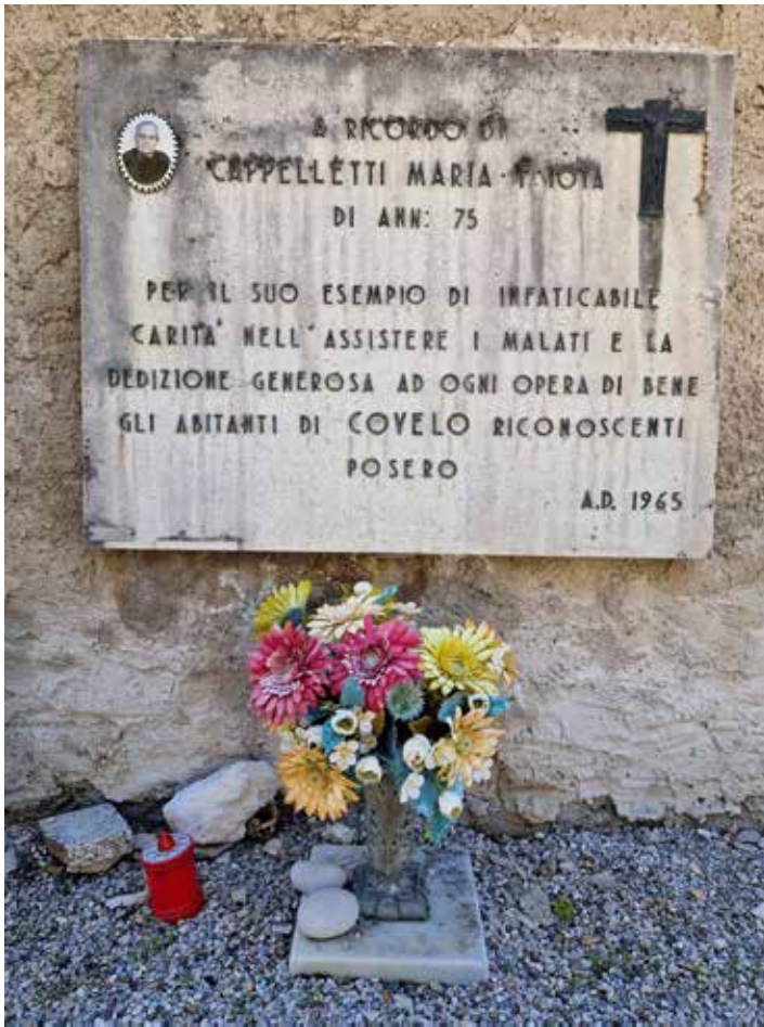
La lapide commemorativa nel cimitero di Covelo