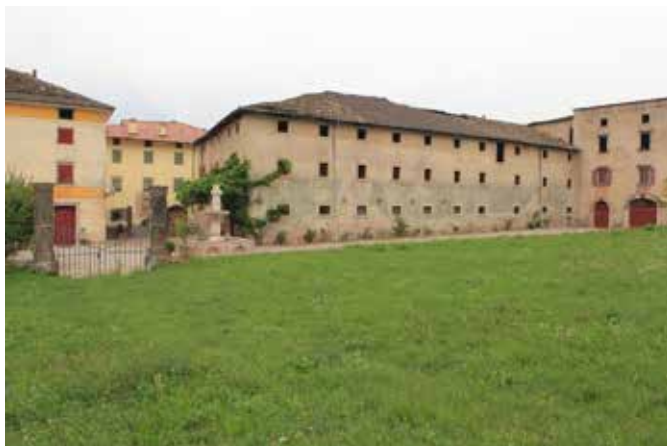
La filanda e la fontana cinquecentesca proveniente da Castel Madruzzo.