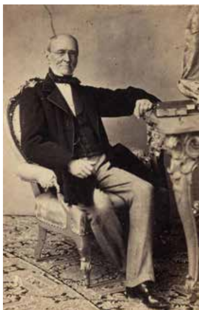
Franz Freiherr von Pillersdorf

scani ed emiliani. Gli avvenimenti del 1848 entrarono in maniera goliardico-proverbiale perfino fra la nostra gente contadina, che si ricordò per un pezzo del quarantaòto per indicare certe faccende contrassegnate da una tal confusione che non prometteva niente di buono, e le rammentava certi briganti – come i Ventuno di Sottovi –, andati incontro a una sorte che s'erano cercati fino in fondo. La nostra poverissima gente doveva pensare talmente alle pance sempre affamate che – anche adesso che poteva fruire del diritto all'istruzione – l'unica cultura di cui poteva disporre era costituita dalla devozione verso un imperatore che nell'intero corso della sua vita aveva forse potuto vedere solo in effigie, e dalle pratiche religiose dispensate da curati quasi sempre lealisti e conservatori.