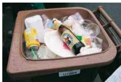
Vetro e plastica nella raccolta dell'umido (Sanzione da € 50,00 a € 300,00)

naturalmente, ai cittadini, che dimostrano di aver compreso il funzionamento del nuovo servizio. È pertanto doveroso da parte di questa Amministrazione ringraziare tutti coloro che ogni giorno spendono qualche attimo del proprio tempo per rendere possibile questi risultati.