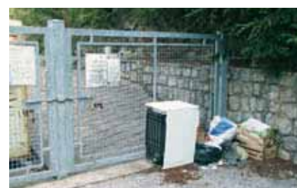
Abbandono di rifiuti a terra fuori dai contenitori per la raccolta differenziata (Sanzione da € 85,00 a € 500,00)

Per risparmiare risorse e non solo con i rifiuti, è necessario tenere a mente la regola della quattro R: Ridurre , Riutilizzare , Riciclare , Recuperare .