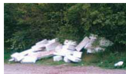
Abbandono indiscriminato di rifiuti (Sanzione da € 85,00 a € 500,00)

conoscenza delle modalità di conferimento, ma, soprattutto, a comportamenti palesemente e consapevolmente scorretti frutto di una scarsa sensibilità e di una basso senso civico. Presso la sede del Municipio sono disponibili opuscoli e pratiche locandine che offrono una dettagliata spiegazione delle modalità di conferimento. Sanzioni severe sono inoltre previste a coloro che introducono nei contenitori rifiuti di composizione merceologica diversa da quella ammessa (da € 50,00 a € 300,00).