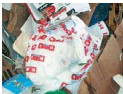
Buste di plastica nella raccolta della carta (Sanzione da € 50,00 a € 300,00)

Per quanto riguarda la qualità, si evidenzia, dai controlli periodici effettuati da ASIA, il non sempre corretto conferimento delle diverse tipologie di rifiuto nei cassonetti. Ciò può essere dovuto alla non precisa