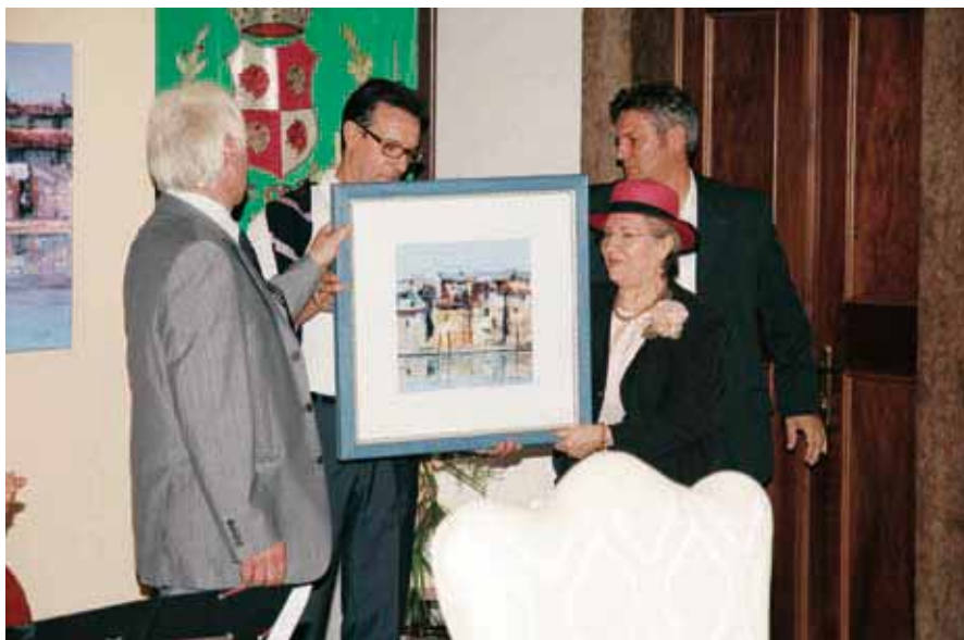
Inaugurazione mostra, quadro di Rossi Zen

“Tutti i colori della Pace” ha ospitato la prima delle serate in programma, richiamando l’articolo 18 del