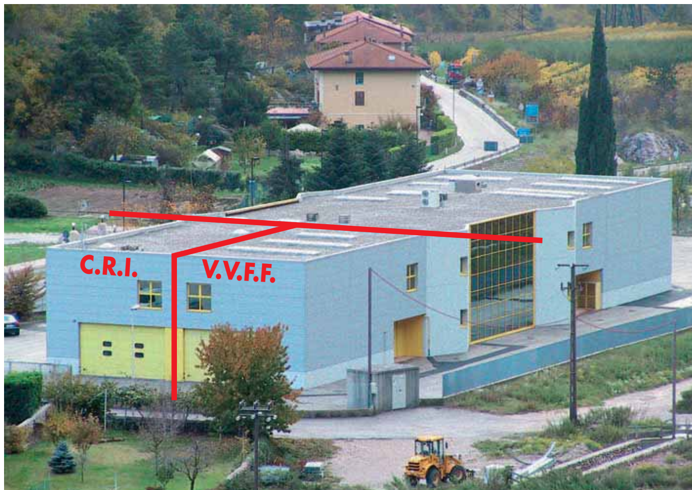
L'ex capannone ENEL (sede Croce Rossa e Vigili del Fuoco)