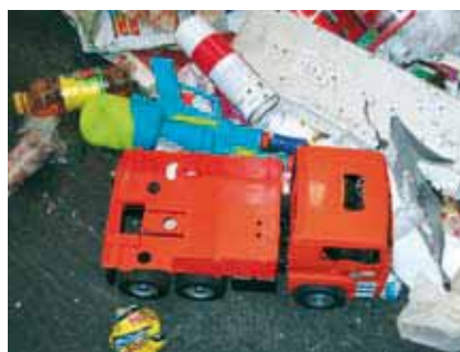
Plastica non da imballaggi nella raccolta della plastica (Sanzione da € 50,00 a € 300,00)

E proprio i risultati ottenuti devono essere da leva per migliorare ulteriormente l'intero sistema di raccolta ed in particolare la qualità della raccolta differenziata e la lotta all'abbandono.